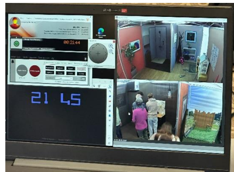
Unter dem wachsamen Blick der Fachpersonen, konnten alle ihr Sicherheitswissen testen.

Mit dem mobilen Escape Game der BFU hatten die Teilnehmenden die Möglichkeit, ihre Sicherheitskompetenz spielerisch unter Beweis zu stellen. Ob im Bereich Sport, Haushalt, Freizeit, Gartenarbeit oder Heimwerken – in Gruppen wurden verschiedene Rätsel gelöst, die sich rund um das Thema sicheres Verhalten drehten. Nach jedem erfolgreich gelösten Rätsel erhielt die Gruppe einen Stern. Sobald alle Rätsel gelöst waren, konnte mit den gesammelten Sternen die Ausgangstür geöffnet werden.